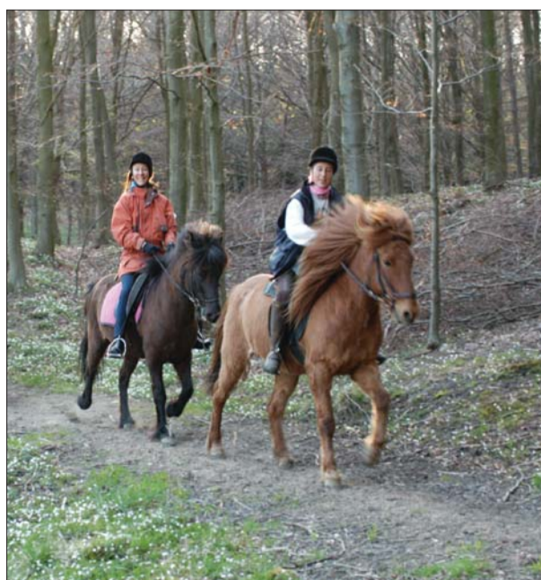
lands største skov.

Vi har i 2009 og 2010 renoveret og moderniseret ridestierne i Gribskov i samarbejde med lokale ryttere. Det er blevet til et ca. 40 km sammenhængende net af ridestier, som sikrer rytternes adgang til de fleste områder i Sjæl-